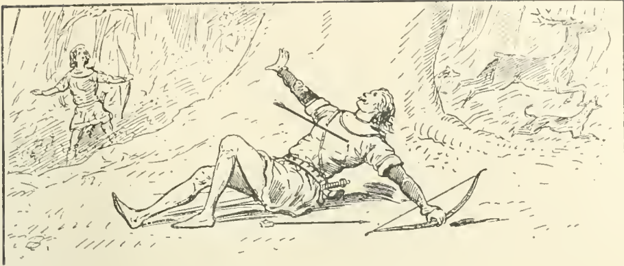
Il tomba sans prononcer un mot. (184)